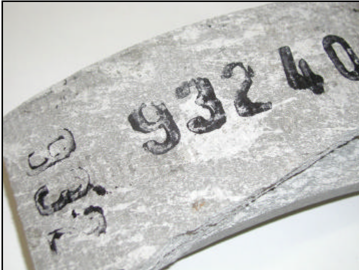
Abbildung.1: Farbe und Oberfläche eines Asbestzementrohrbruchstückes